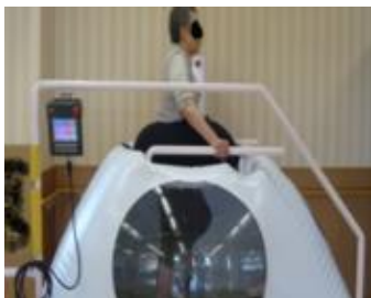
90代女性、歩行困難だが機器使用により歩行可能となった例

1. 「廃用症候群予防のための新たなリハビリテーション機器の効果についての研究」 近年、わが国の人口高齢化を背景に、内部障害者や骨関節疾患を合併した重複障害者に対する、安全で患者に低負担な運動プログラムのニーズが高まっている。下図はそれらの運動メニューの例である下肢陽圧免荷トレッドミル、下肢低周波電気刺激、血液透析中の自転車運動の例である。