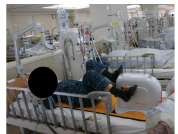
血液透析中の運動例