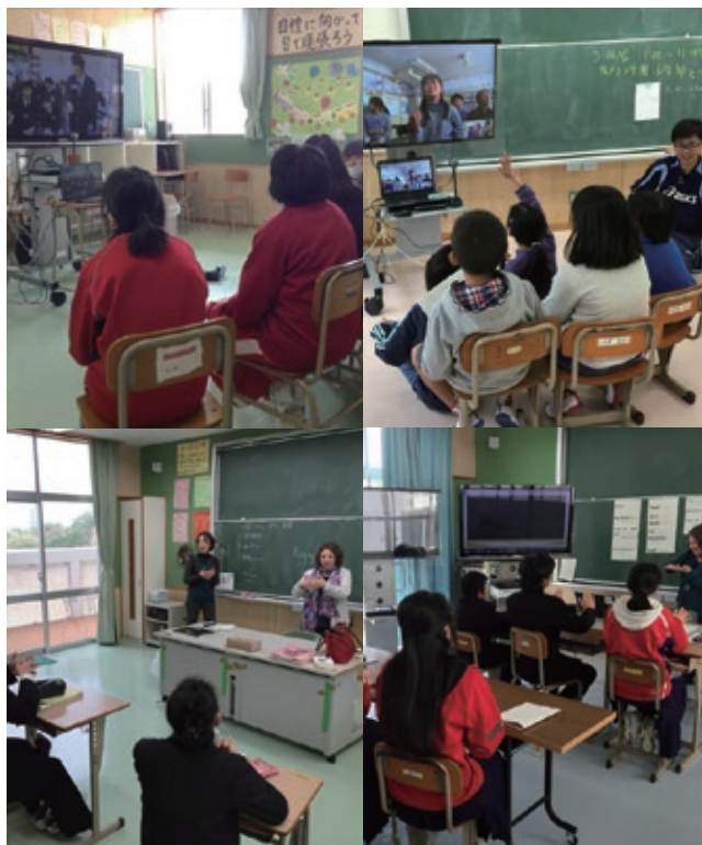
遠隔交流と英語交流の様子