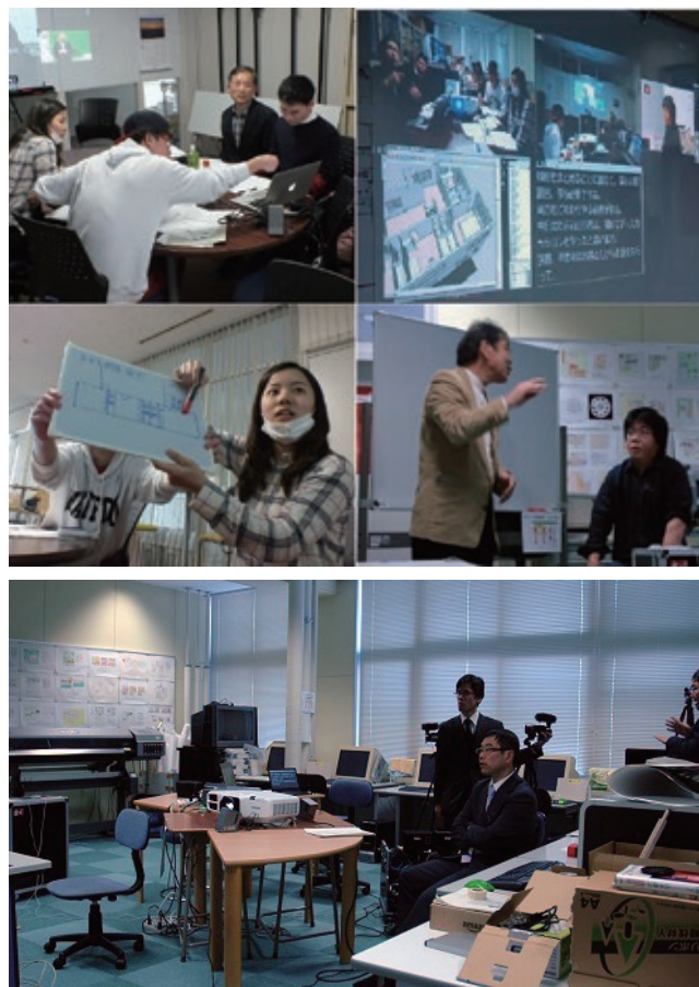
上：遠隔協調授業の様子、下：北海道高等聾学校会場の様子