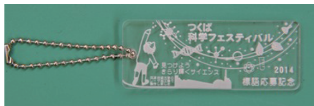
キーホルダーを担当者に手渡す様子とキーホルダー