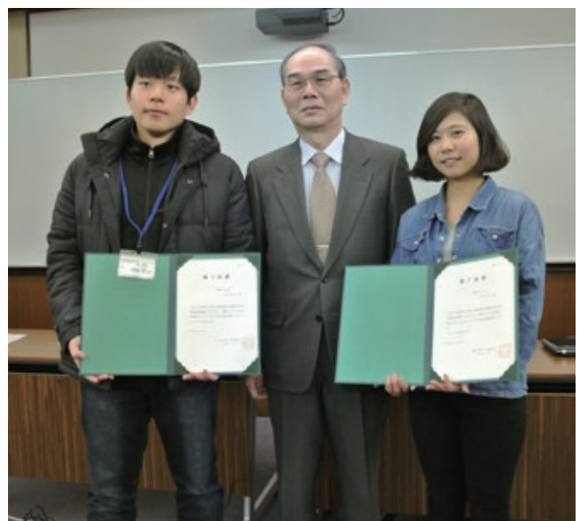
修了証書を受け取った参加学生と学長の様子