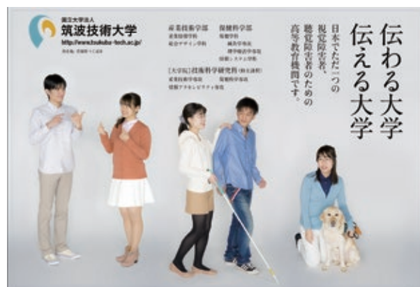
秋葉原駅に掲出したサインボードデザイン