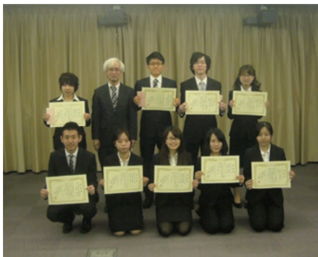
内藤産業技術学部長と受賞者の集合写真