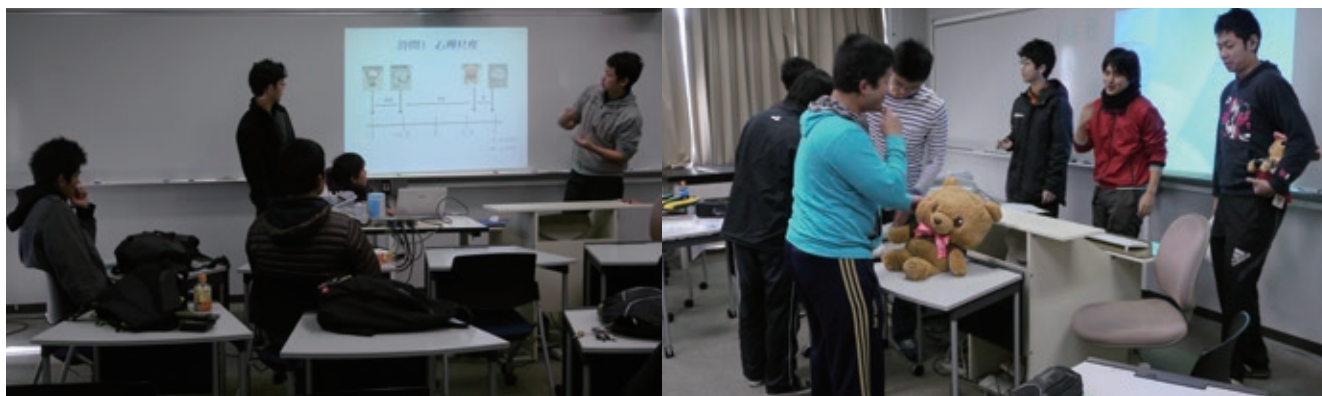
コミュニケーション科学の授業の様子