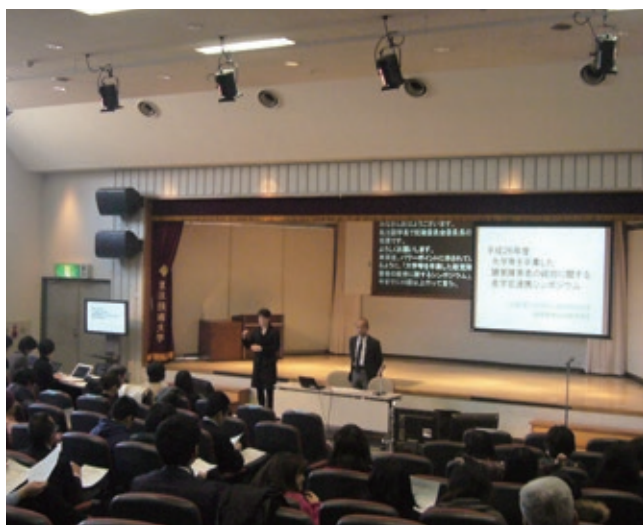
石原聴覚障害系就職委員会委員長のあいさつ