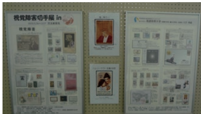
展示されたパネル