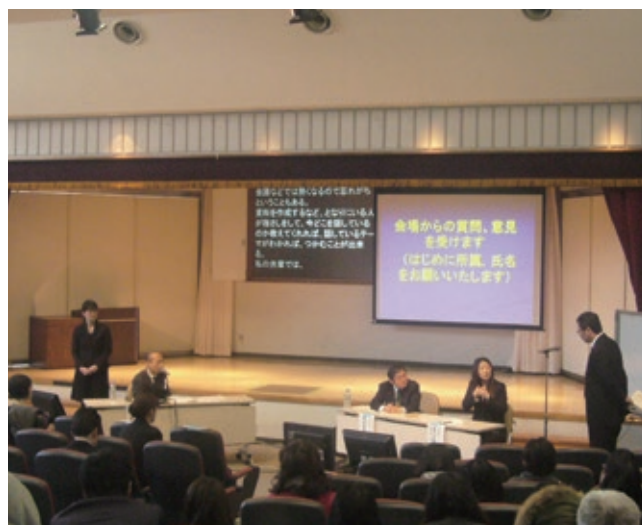
ディスカッションの様子